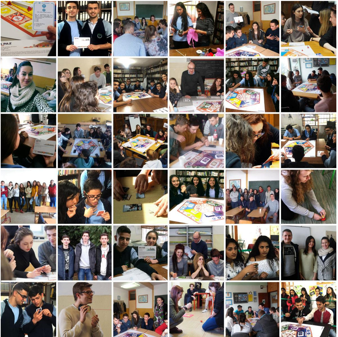
Kallipoly