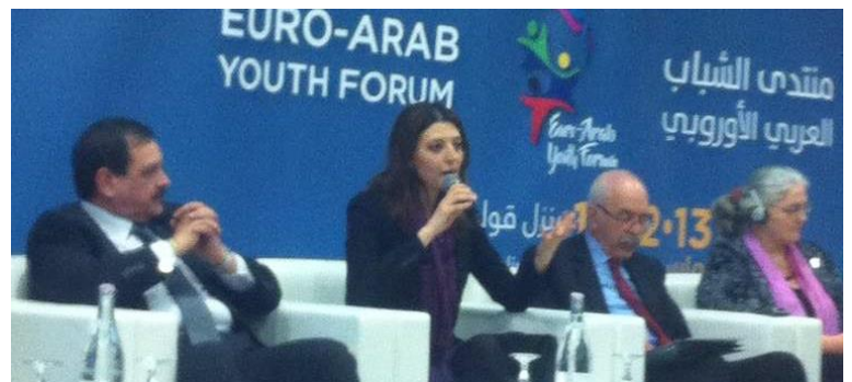
Amb. Hatem Atallah, Mme. Faten Kailel, secrétaire d'État , de la Ministre de Jeunesse et Sports

Le Forum a commencé avec une session plénière où cinq honorables intervenants ont présenté leurs approches par rapport à la culture, comme rempart des temps modernes face à la violence et la radicalisation. La session a été suivie par des ateliers et débats sur les thèmes suivants : Culture face à la violence dans l'espace public, Culture face à la radicalisation et Culture comme moyen d'intégration des migrants dans leurs pays d'accueil. D'ailleurs, les ateliers ont eu pour but de fournir aux jeunes des outils pour développer des projets interculturels communs.