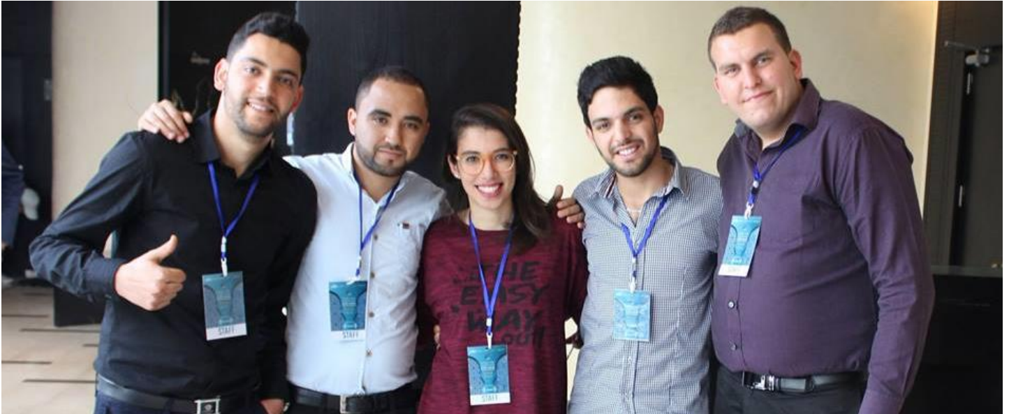
PolyExpo, organisateurs

L'événement a compris diverses activités interculturelles, parmi lesquelles : une Foire Interculturelle, où chaque participant a été invité à présenter son pays et sa culture. Les soirées ont été animées par des programmes artistiques, ayant pour but d'informer le public de la richesse culturelle et artistique de la Tunisie et de ses différentes régions à travers ses costumes et son art culinaire. Les activités interculturelles ont été terminées par un circuit culturel traversant Kairouan et Sousse.