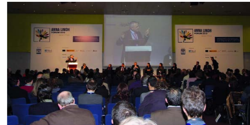
Imagen de la inauguración del Foro en el Centro de Convenciones Internacional de Barcelona (CCIIB)