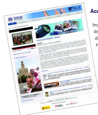
Los resultados y las experiencias de las acciones pueden verse en la web http://redespaniolafal.iemed.org/es/vecinos

Colaboramos con los medios de comunicación para mejorar tanto la difusión de los cambios sociales y culturales en la región euromediterránea como para fortalecer el diálogo entre las sociedades. Con el objetivo de luchar contra las ideas preconcebidas, se crean programas y herramientas específicas y se organizan encuentros entre periodistas y organizaciones de la sociedad civil.