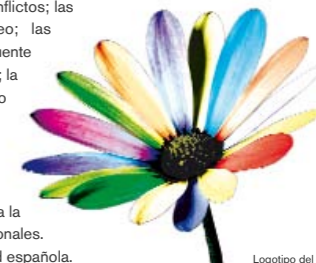
Logotipo del Foro

Es el mayor encuentro de la sociedad civil euromediterránea para la promoción del diálogo intercultural y se celebra cada dos años. Organizado en Barcelona en marzo de 2010, el primer Foro reunió a más de 1.000 participantes. Además de representantes de las redes de 43 países que conforman la Fundación, asistieron también personalidades del Mediterráneo y profesionales expertos en cuestiones interculturales. En el Foro se discuten cuestiones como la enseñanza intercultural a la juventud; las vías de restablecimiento de la coexistencia después de conflictos; las colaboraciones artísticas y culturales en el Mediterráneo; las migraciones y la diversidad social en las ciudades; el papel de puente de los medios de comunicación en las percepciones culturales; la necesidad de una estrategia intercultural en el Mediterráneo, o los valores, la religión y la espiritualidad en las sociedades mediterráneas. También se celebran sesiones informativas sobre proyectos, buenas prácticas y experiencias.