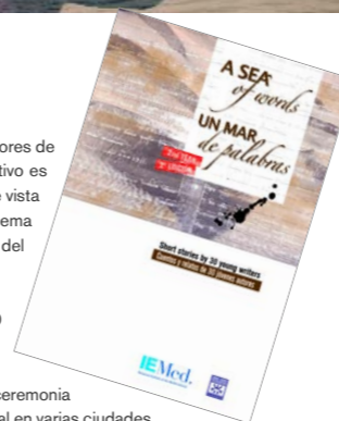
Una antología colectiva reúne los mejores relatos de cada edición

En las cuatro ediciones celebradas hasta ahora se han recibido más de 850 originales, de los que cada año 20 son seleccionados por su calidad literaria por un jurado internacional integrado por escritores y críticos literarios. Las personas galardonadas participan en un programa de actividades culturales: ceremonia de entrega de premios en Barcelona, diferentes acciones de diálogo intercultural en varias ciudades españolas y dos talleres internacionales organizados por otras redes de la FAL. Además, sus relatos son publicados en una antología colectiva.